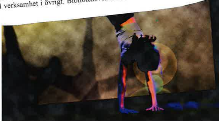
Unga cirkus-och danselever intar scenen på Drömmarnas Hus.

Biblioteken i det allmänna biblioteksväsendet ska främja litteraturens ställning och intresset för bildning, upplysning, utbildning och forskning samt kulturell verksamhet i övrigt. Biblioteksverksamhet ska finnas tillgänglig för alla.